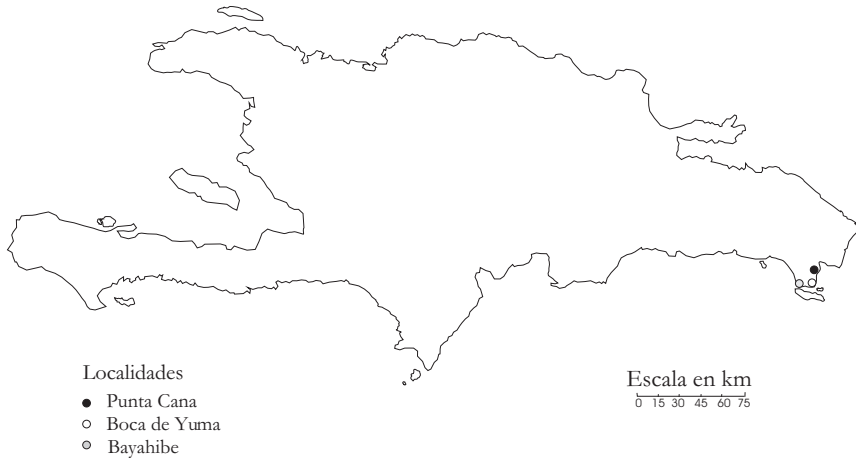
Fig. 6. Distribución de Dendrodesmus yuma sp. nov. en la Hispaniola.

Dominicana, así como la publicación de éste artículo.